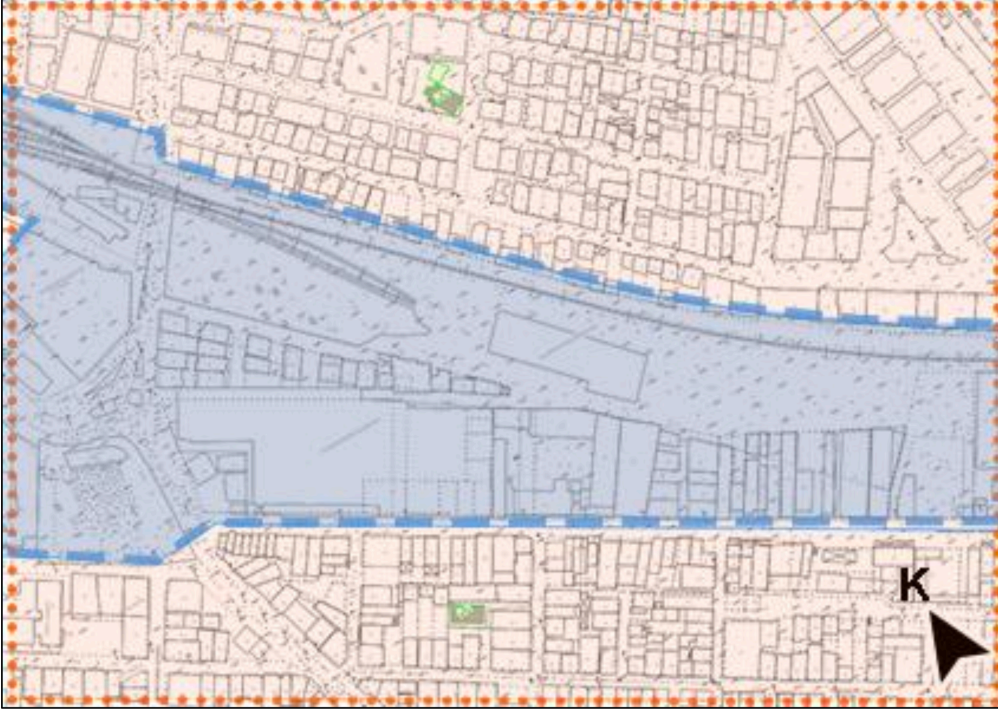
Şekil 2: Odak Alan Pafta Düzeni